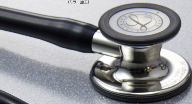
6177 Mirror Edition (ミラー加工)