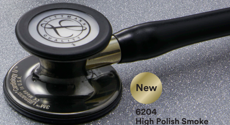
6204 High Polish Smoke Edition (ハイポリッシュスモーク加工)