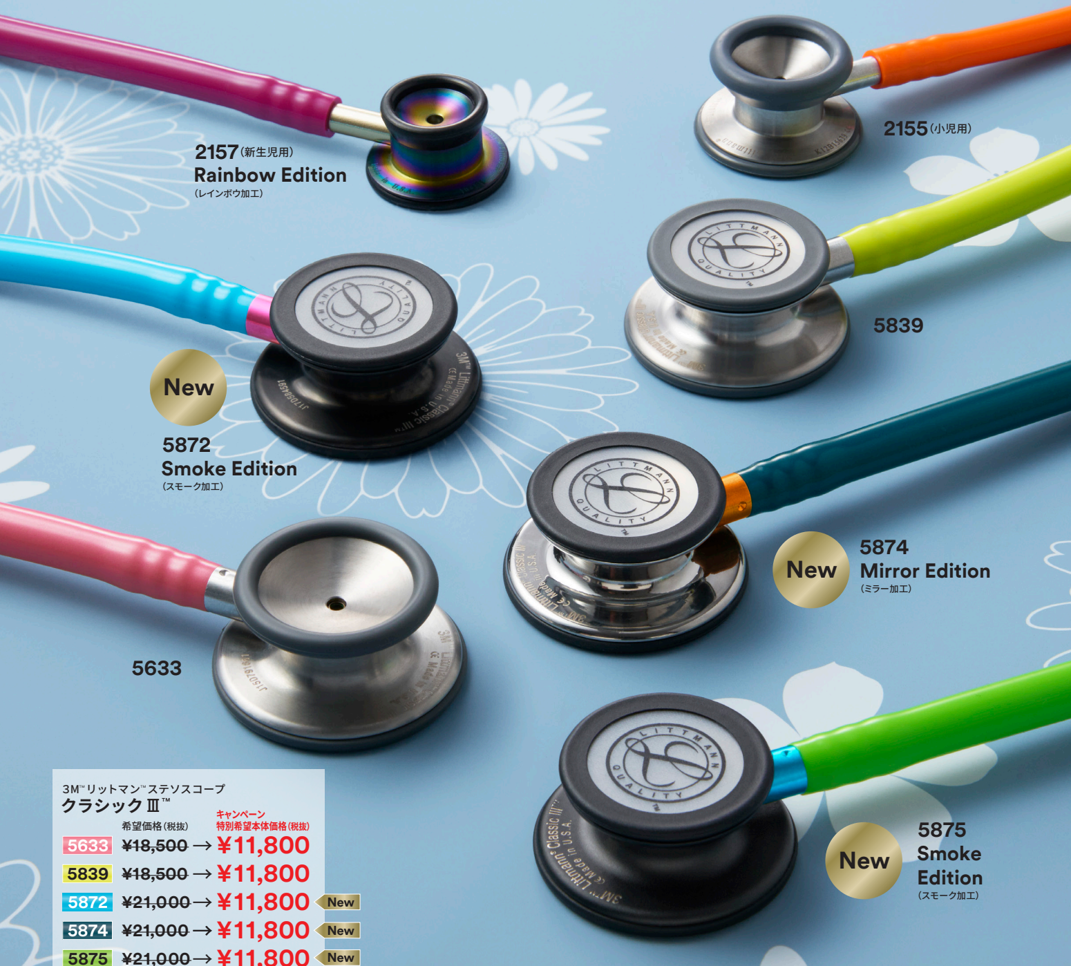
2157 (新生児用) Rainbow Edition (レインボウ加工)

クラシックシリーズには、バリエーション豊富なチューブとチェストピースを取り揃えています。