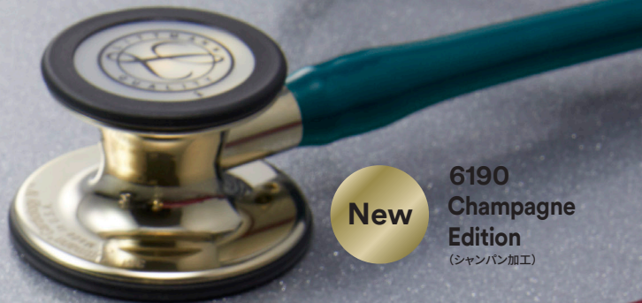
6190 Champagne Edition (シャンパン加工)